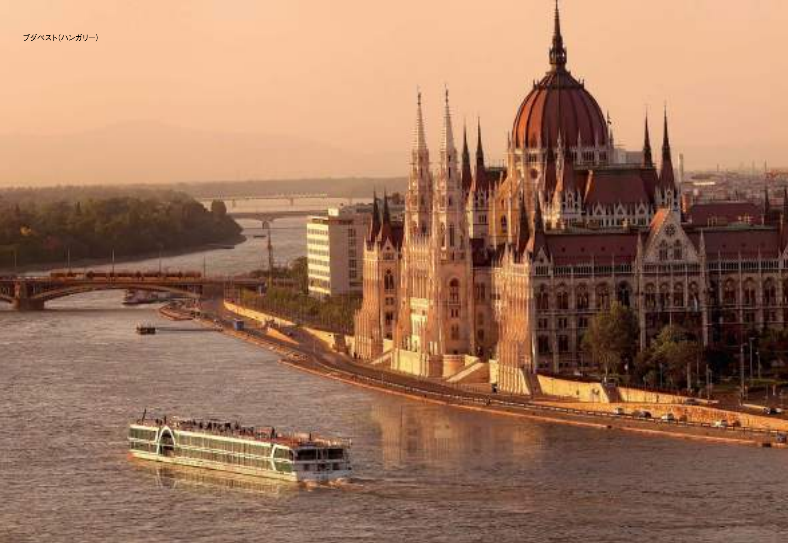
ブダペスト(ハンガリー)