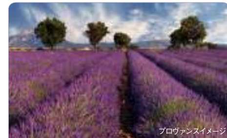
プロヴァンスイメージ