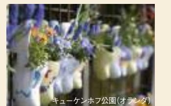
キューケンホフ公園(オランダ)

アムステルダム、ゲント、アントワープなど、絵画のように美しい場所を訪れるクルーズです。特殊な水路に沿って、世界で最も美しいとされる壮大なチューリップ畑や有名な園芸を訪問します。オランダの南部に位置するキューケンホフ公園は、ヨーロッパ最大の花園で、春には世界でいちばん美しいと言われる「ヨーロッパの庭園」です。チューリップや水仙、ヒヤシンスなど700万本以上の花が咲き誇る、この時期にしか見ることのできない景観をぜひご覧ください。