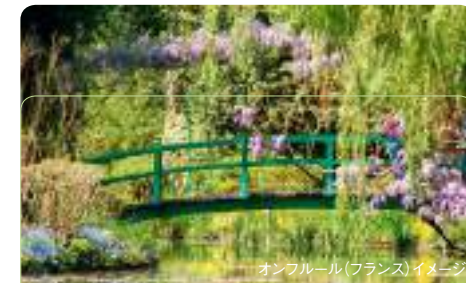
オンフルール(フランス)イメージ