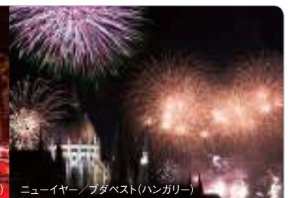
ニューイヤー/ブダペスト(ハンガリー)