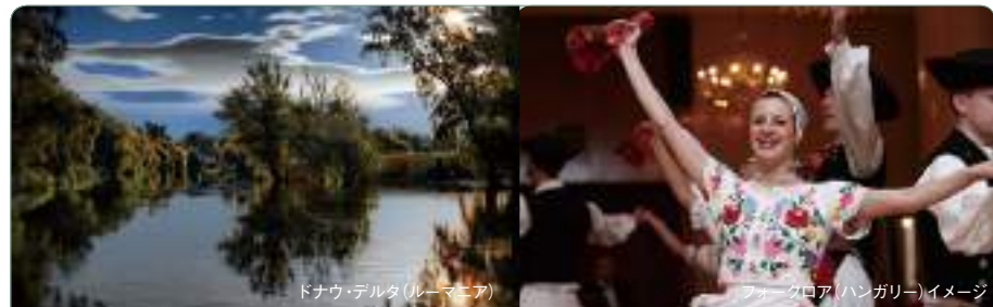
ドナウ・デルタ(ルーマニア)