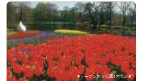
キューケンホフ公園(オランダ)