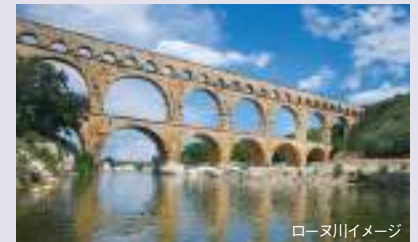
ローヌ川イメージ

色鮮やかな南フランスのブルゴーニュ地方やプロヴァンス、カマルグをめぐるクルーズです。ローヌ川、ソーヌ川をゆくこのクルーズではフランス流の人生の楽しみ方や素晴らしい景色を堪能していただけです。美食の街リヨンから始まりリヨンで終わるクルーズでは、ブドウ畑を通りながらメイコンやワインで有名なボジョレーを巡ります。また教皇宮殿が有名なアヴィニオンやカマルグの自然保護区、アルデシュの渓谷などが見どころです。