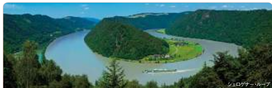
シュロケナー・ループ