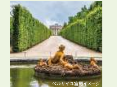
ベルサイユ宮殿イメージ

花の都パリを発着地とするクルーズ。印象派絵画の巨匠、ゴッホ、セザンヌ、そしてゴーギャンらの軌跡をパリからセーヌ川下流のルーアン、続いてノルマンディー地方のコドゥベック＝アン＝コーへと辿ります。第二次大戦中のノルマンディー上陸作戦で有名なビーチを訪れるエクスカーションもご紹介します。