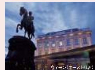
ウィーン(オーストリア)