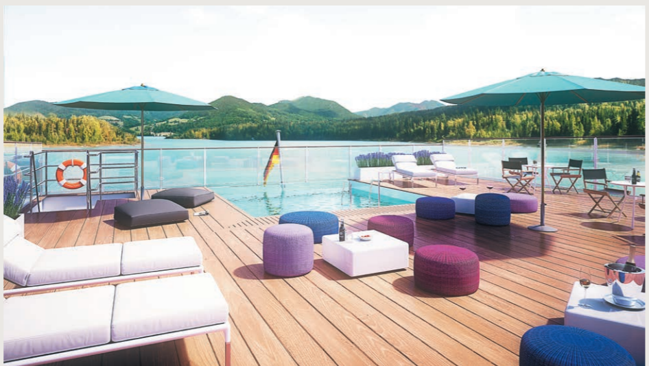
インフィニティプール(アマデウス・プロヴァンス)