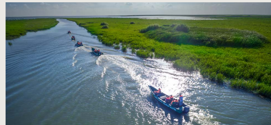
ドナウデルタ(イメージ)