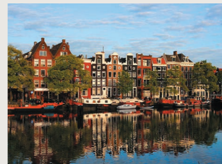
アムステルダム(イメージ)