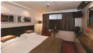
▲ハイドンデッキ(イメージ)