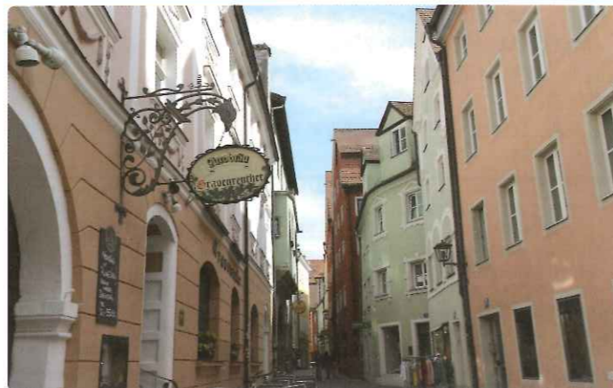
▲レーゲンスブルクにて(イメージ)