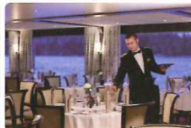
▲レストラン(イメージ)