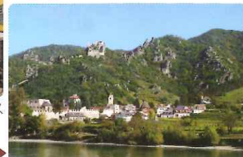
▲ヴァッハウ渓谷にて(イメージ)