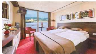
▲ストラウスデッキ(イメージ)