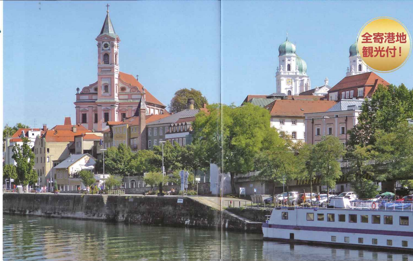
▲パッサウにて(イメージ)