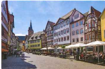
▲ライン河とタウパー川に囲まれたヴェストハイム(イメージ)