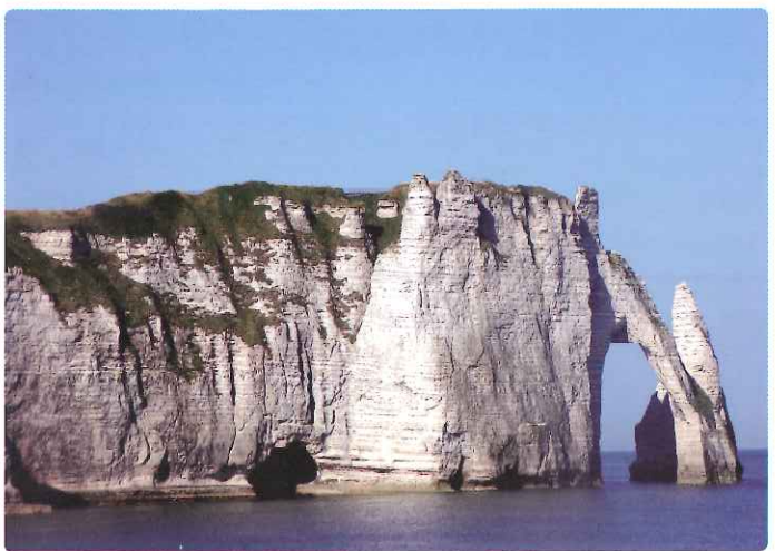
▲エトルタの石灰岩の断崖(イメージ)

古くから交通、貿易発展のためには欠かせない存在であったヨーロッパの河川。河を中心として人・モノが行き来し、街が形成、発展していきました。この旅では、フランス4大河川の一つセーヌ川をパリから河口の港町まで、そして再びパリへ6泊7日のリパークルーズにご案内します。セーヌ川が流れるノルマンディ地方は、フランスでも有数の景勝地です。セーヌ川岸に点在する素敵な街々、田園風景がどこまでも続くのどかな様子はまるで絵画をみているかのようです。 パリからオンフルールまで、車では、わずか3時間。今回のクルーズは、ゆったりのんびり時間を贅沢に使う旅です。