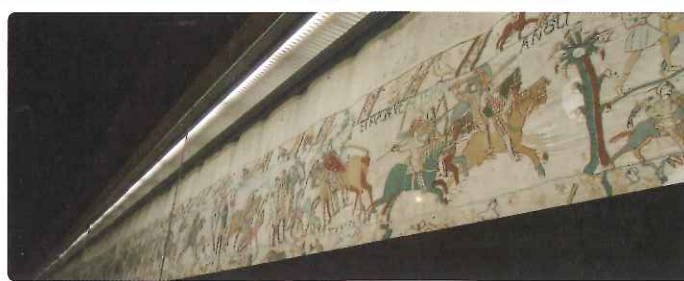
▲バイユーの「マチルダ王妃のタペストリー」。11世紀に制作された、幅70mのタペストリーは58の場面からなり、ウィリアム王たちの征服の歴史が描かれています。

ハイドンデッキ(1階)の窓が上部のお部屋利用(15㎡) 10月22日(火) 598,000円 お一人部屋利用追加代金(相部屋可) 70,000円 プレミアムエコノミークラス利用追加代金 +150,000円 ビジネスクラス利用追加代金 +350,000円