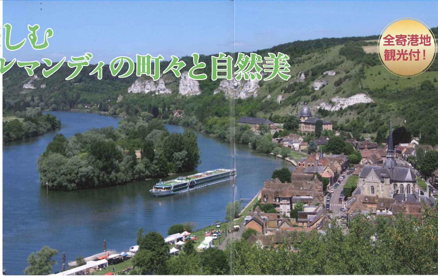
▲レ・ザンドリ近郊にて(イメージ)

早割150キャンペーン実施中! ※詳しくは裏表紙をご覧ください。 MS.アマデウス・ダイヤモンド号 セーヌ川クルーズと ノルマンディ、パリの休日 10日間 ツアーコード: TRFO