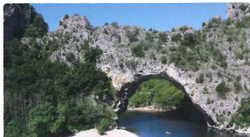
▲ヨーロッパのグランドキャニオンといわれるアルデシュ渓谷(イメージ)