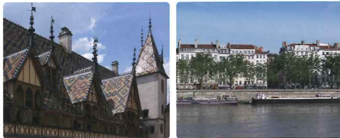
▲ポヌのオテル・デュ

ローヌ・ソーヌ川を往きながら、色鮮やかな南フランスのブルゴーニュ地方やプロヴァンスを巡り、フランス流の人生の楽しみ方や素晴らしい景色をご堪能ください。