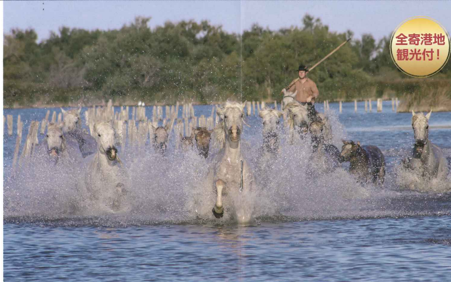
▲カマルグ湿原地帯にて(イメージ)