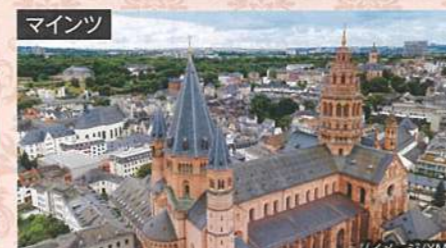
ライン川とメイン川の合流地点にある街。古くから交易や軍事上の要所として栄えました。(イメージ/AM)