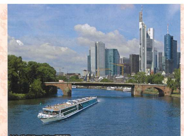
LUFTNER CRUISES MSアマデウス・シルバーIII