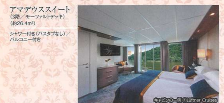
アマデウススイート (3階/モーツァルトデッキ) (約26.4m 2 )